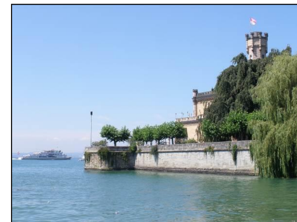
Schloss Montfort in Langenargen/Bodensee