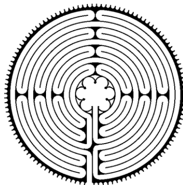
Abb.: Das Labyrinth von Chartres