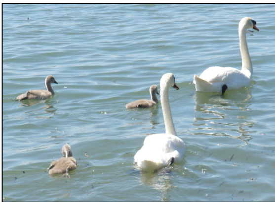
Schwäne auf dem Bodensee in Langenargen

Kontoinhaberin: Ina Ströbele Text: Name + Vorname + MVWE14 + EZ + Ges oder ANZ oder Rest IBAN: DE33 6905 0001 0020 1212 16 BIC: SOLADES1KNZ Bei: Sparkasse Bodensee